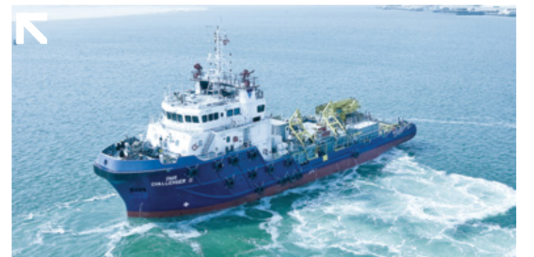
"دي ام اس شالينجر ٢" سفينة دعم متعددة الأغراض بطول ٥٨ م وقوة ٤٠٠٠ بي أتش بي وتعمل في بحر العرب

ملاحظة: إيرادات ٢٠١٣ تشمل ٢,١ مليون ر.ع وأرباح تشغيل تشمل ربحاً قدره ١,١ مليون ر.ع من بيع سفينة.