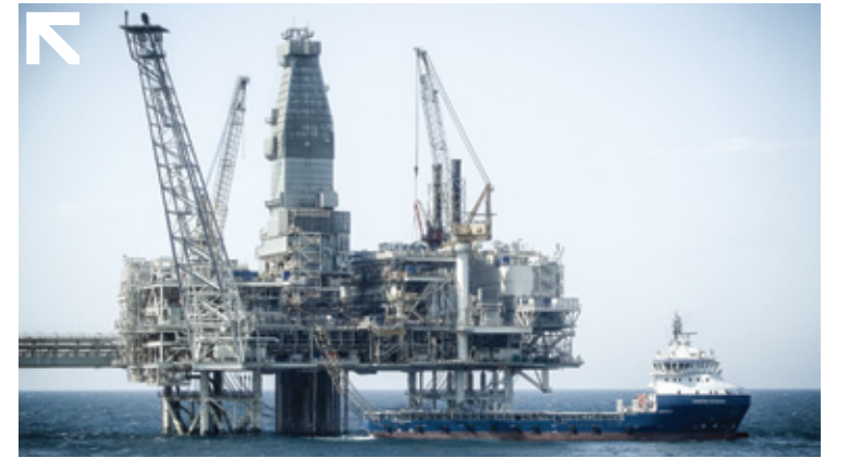
"كاسيبان فوجير" سفينة تزويد منصية ذات حمولة ٤٠٠٠ طن (دي دبليو تي) تعمل في بحر قزوين

قمتنا في هذه الفترة (النصف الأول) باستثمارات رأسمالية بلغت ٧٩,٣ مليون ر.ع (٢٠٦,١ مليون دولار أمريكي) لأغراض النمو حيث بلغ الإنفاق الرأسمالي لتنمية أسطول توياب لدعم البحري حتى الآن ٧٤,٦ مليون ر.ع (١٩٢,٩ مليون دولار أمريكي) كما بلغ الإنفاق الرأسمالي لنفس الفترة في مجموعة خدمات العقود ٤,٧ مليون ر.ع (١٢,٢ مليون دولار أمريكي). سيرتفع مستوى الاستثمار في مجموعة خدمات العقود بصورة كبيرة عند قيام الشركة بتطوير مشروع مرافق السكن الدائم للمقاولين بالدقم.