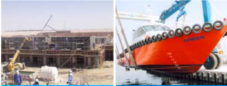
الغارب دي إن في إكسبريس ١٩ أثناء تسليمه إلى ميكلين إكسبريس أوفشور

عن أنشطة الدمج والحيازة . إن اهتمامنا الأساسي في المستقبل لا يزال يتركز حول توسيع الإلتئان الجغرافي لأسطول سفن الدعم البحري حين تسنح الفرصة لذلك ، إلا أن ذلك لا يستبعد توسيع الأعمال التجارية الأخرى . وسوف نظل نعتد في أي فرص محتملة للبيع الإضطرابي للأصول والأعمال التجارية بسعر أقل خلال هذه الأوقات الصعبة ، إلا أننا نؤكد مرة أخرى بأن أي مبادرة محددة سوف تخضع لأسلوب حصيلف يركز على السلامة أولاً ، ميزانيتها العمومية . ومع ذلك فإنني أكرر مرة أخرى تأكيددي في التقرير السنوي بأننا سوف لن نضيع الفرص الناشئة عن هذه الأزمة .