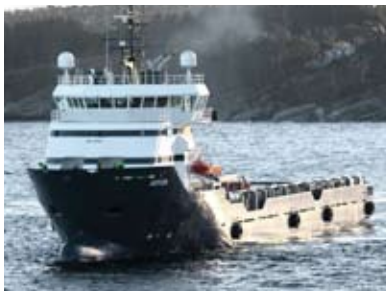
كاسيبان سيرفر أثناء الاختبار في الترويج