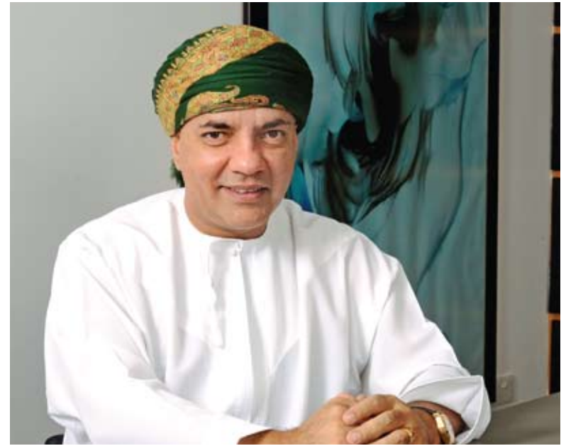
الأفضل المساهمين الكرام ، السلام عليكم ورحمة الله وبركاته .

بالتبابة عن مجلس الإدارة يسرني أن أقدم لكم القوائم المالية غير المدققة لشركة النهضة للخدمات ش.م.ع.ع لفترة الثلاثة أشهر المنتهية في ٣١ مارس ٢٠٠٩م .