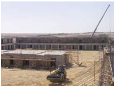
المساكن الدائمة للمقاولين لشركة تنمية نفط عمان في مرمول

إن نتائج الربع الأول الإيجابية تصلح لكي تؤكد قناعتنا الحذرة ولكن الواثقة بمرونة شركة النهضة للخدمات تجاه الإنكماش الاقتصادي العالمي الصارم . كذلك فإننا قادرون على أن نطمئن مرة أخرى الجهات ذات المصلحة في الشركة بأن نظرنا الإيجابية تظل كما هي دون أي تغيير كما نؤكد مرة ثانية وعدنا لكم بإفادتكم بأي تطورات إيجابية مهمة ومؤكدة أو أي نكسات سلبية لوجهة نظرنا هذه . ونحن مستمرين في النمو إستناداً إلى قوة دافعة مستدامة ، ونظل مشغولين كما كنا دائماً بالسمي نحو أي فرص إضافية لتحقيق النمو في كل من أعمالنا التجارية وقيمة استثمارات المساهمين الراسخة .